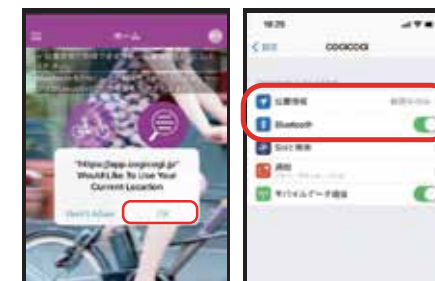
ポップは全てOKを選択!「COGICOGI」アプリ設定